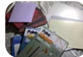
Carta a scelta per il corpo dei libri