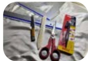
Forbici, taglierino, pieghetta (stecca d'osso), riga e squadre