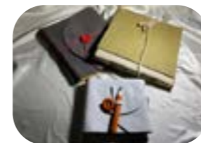
Legatura a taccuino medievale