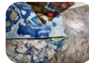
Carta di vario tipo e spessore, decorata a mano o di recupero da incisioni per rivestire i piatti di copertina