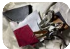
Pezzi di cuoio, pelle sintetica o naturale