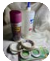
Colla vinilica o colla spray, nastro di carta e biadesivo