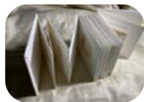
Leporello con coperta rigida