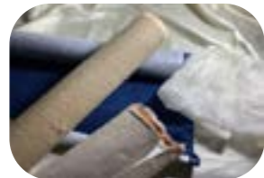
Pezzi di tela da pittura, all'occorrenza tela da legatoria