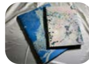
Legatura a pergamena floscia